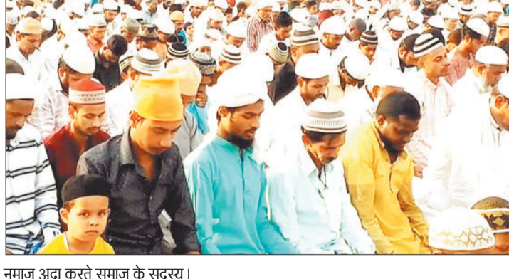
नमाज अदा करते समाज के सदस्य।

सोमवार को अकीदत के साथ बकरीद मनाई गई। सुबह लोगों ने मस्जिद और इंग्रहाओं में नमाज अदा की गई। नमाज के बाद घरों में त्याग और बलिदान की भावना के साथ बकरों की कुर्बानी दी गई। मुस्लिम धर्म गुरुओं ने बताया कि कुर्बानी अल्लाह को बहुत प्यारी है। कुर्बानी के गोशत का तीन हिस्सा कर एक हिस्सा गरीबों को सदाका किया जाता है। दूसरा हिस्सा दोस्त, रिश्तेदारों, पड़ोसियों को और तीसरा हिस्सा खुद इस्तेमाल किया जाता है। शहर से लेकर ग्रामीण इलाकों तक धूमधाम से बकरीद त्यौहार मनाया गया। मस्जिदों में नमाज पढ़ने के बाद एक-दूसरे को गले मिलकर बकरीद की मुबारकबाद दी। मुस्लिम बंधुओं ने मुल्क की खुशहाली, तरक्की, शांति और भाईचारे के लिए दुआ मांगी। कुर्बानी कबूल करने के लिए अल्लाह ताला से दुआ मांगी गई। नमाज के बाद लोग कब्रिस्तान में फातिहा भी पढ़ने पहुंचे। यहां