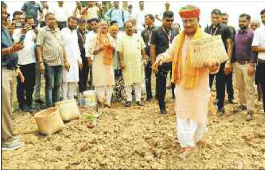
अपने खेत में धान की बोनी करते मुख्यमंत्री साय।

खेती-किसानी को लेकर जशपुर, सरगुजा अंचल के किसानों में परंपरा है, कि परिवार के लोग मुखिया के साथ धान की बोनी की रस्म निभाते हैं। मुख्यमंत्री