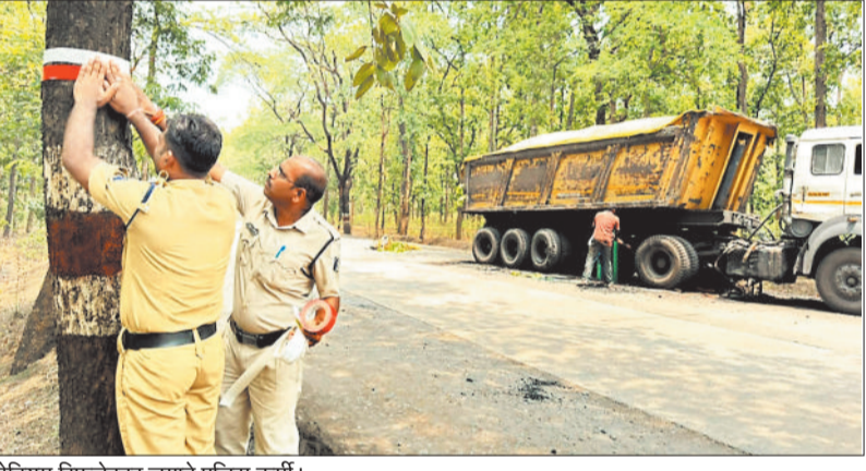
रेडियम रिफ्लेक्टर लगाते पुलिस कर्मी।