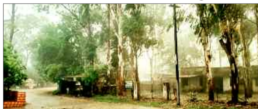
प्री मानसून की बारिश से तरबतर हुआ जशपुर।

सकता है। पिछले कई बरसों से (मानसूनी बारिश में देर हो रही है। सामान्यतया 15 जून तक छत्तीसगढ़ में मानसून सक्रिय हो जाना करता है। मौसम विज्ञानियों के अनुसार 21 जून तक सरगुजा संभाग और जशपुर जिले में मानसून के बारिश होने की संभावना है।