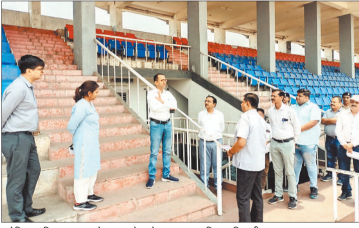
स्टेडियम परिसर का अवलोकन करते कलेक्टर व प्रशासनिक अधिकारी।

रिसदी के समीप निर्मित विवेकानंद शैक्षणिक परिसर के सभी हॉल, दुकानों का जायजा लेते हुए कलेक्टर ने पूरे परिसर का निरीक्षण किया एवं निर्माण कार्य के संबंध में पूरी जानकारी ली। उन्होंने कहा कि एक ही छत के नीचे विभिन्न शैक्षणिक गतिविधियां संचालित करने के लिए यह परिसर तैयार किया गया है। इसके संचालन से नगरवासियों को काफी लाभ मिलेगा। इस हेतु परिसर में जल्द से जल्द कोचिंग एवं दुकानों के संचालन हेतु निगमायुक्त को आवश्यक कार्यवाही करने के निर्देश दिए। इसी प्रकार कलेक्टर ने डिगापुर स्थित ई-